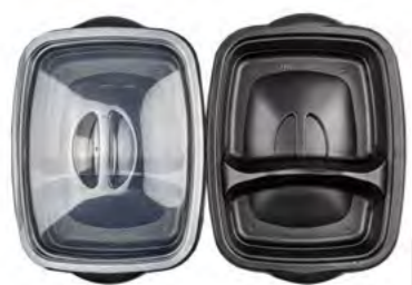
MW Schale 打包盒 (微波炉可用)