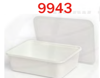
9943 1-fach weiß 750 mL 白色单格打包盒 750 mL