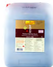
Sojasoße dunkel LKK 老抽 (李锦记) 2×8 L