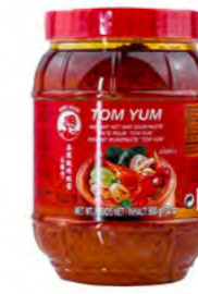
Tom Yum Paste 冬荫功酱 12×900 g