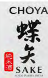
Sake Choya 15% Alc. Choya 清酒 15% 5 L