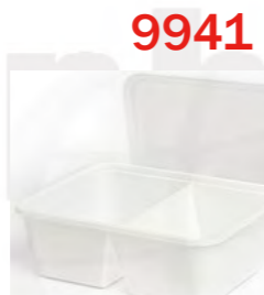
9941 2-fach weiß 1000 mL 白色两格打包盒 1000 mL