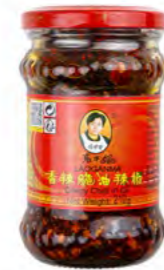
LGM Peanuts in Chiliöl 油泼辣子 (老干妈) 24×275 g