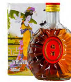
Pflaumenwein XO 梅酒 XO 24×200 mL