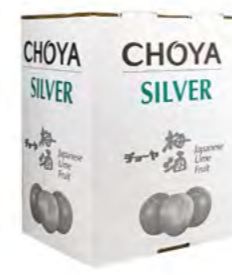
Pflaumenwein Choya Silver 梅酒 Choya Silver 10 L