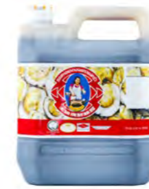
Austersosse MAEKRU 蚝油 (泰国主妇牌) 3×4,5 L