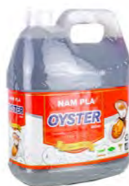
Fischsosse Auster 蚝油鱼露 4×4,5 L