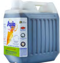
Fischsauce SQUID 鱼露 SQUID (桶装) 3×4,5 L