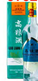
Kao Liang 62% Alc. 高粱酒 62% 6×500 mL