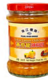
Chilisauce gelb 黄灯笼辣椒酱 24×240 g