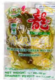
Senfsauerkohl eingelegt 芥末腌白菜 36×350 g