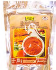
Mix für Sate Sauce LOBO 混合沙爹粉 (LOBO) 12×400 g