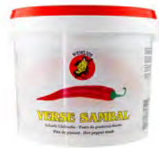
Sambal Olek WENDJOE 三巴辣酱 (Wendjoe) 15 kg