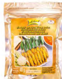
Würzpaste Satemarinade LOBO 调味沙爹粉 (LOBO) 12×400 g