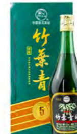
Bambusschnaps 45% Alc. 竹叶青酒 45% 6×500 mL