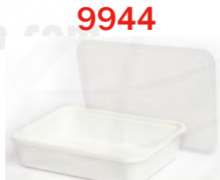
9944 1-fach weiß 500 mL 白色单格打包盒 500 mL

Super Quality Microwave (SQ MW) Schale SQ 打包盒 (微波炉可用) 50 Stk.