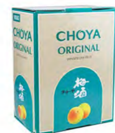
Choya japanisch Ume Choya 日式梅酒 5 L