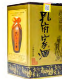
Konfuzius Schnaps 39% Alc. 孔府家酒 39% 500 mL