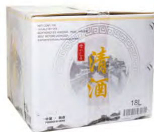
Sake 13% Alc. 清酒 13% 18 L