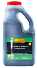
Teriyakisauce LKK 照烧酱 (李锦记) 2×1,8 L