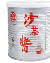
Sa Cha (BBQ) Sosse 沙茶酱 12×737 g