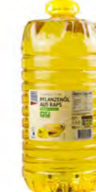
Rapsöl 菜籽油 10 L