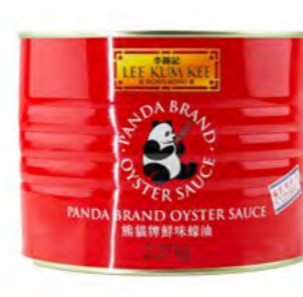
Austern Soße LKK 蚝油 (李锦记) 6×2,27 kg