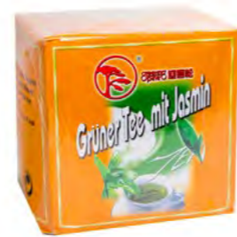
Jasmin Tee 茉莉花茶 12×1000 g