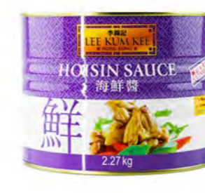
Hoi Sin Sosse LKK 海鲜酱 (李锦记) 6×2,27 kg