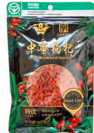
Getrocknete Gou-Qi 干枸杞 200 g