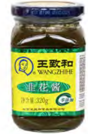
WZH Schnittlauchpaste 王致和非花酱 24×320 g