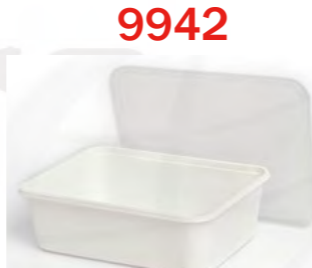
9942 1-fach weiß 1000 mL 白色单格打包盒 1000 mL