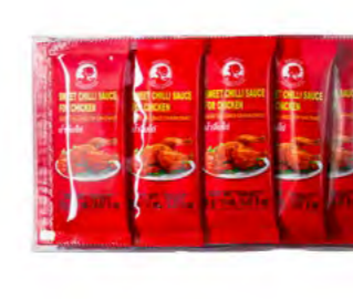
Süßsauersauce in Beutel 袋装甜面酱 8×45×14 g