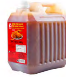
Süße Chilisauce für Huhn (Cock) 鸡肉甜辣酱 (Cock) 3×4,5 L