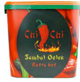
Sambal Olek Chi Chi 三巴辣酱 (ChiChi) 10 kg