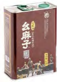
Pfeffer Öl YAOMAZI 么麻子花椒油 4×2,5 L