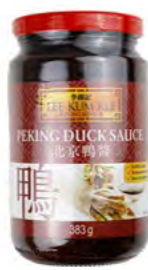
Peking Ente Soße 北京烤鸭酱 (李锦记) 12×383 g