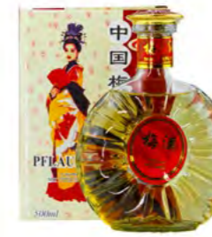
Pflaumenwein XO 梅酒 XO 12×500 mL