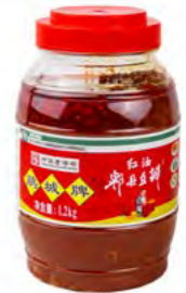
Saubohnen Soße mit Chilli 郫县豆瓣 8×1,2 kg