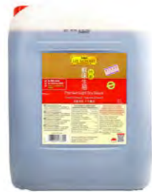
Sojasoße hell LKK 生抽 (李锦记) 2×8 L