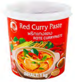
Currypaste rot 红咖喱酱 12×1 kg