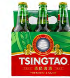
Tsingdao Bier 青岛啤酒 24×330 mL