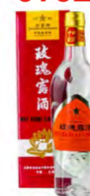
Mei Kueilu 54% Alc. 玫瑰露酒 54% 6×500 mL