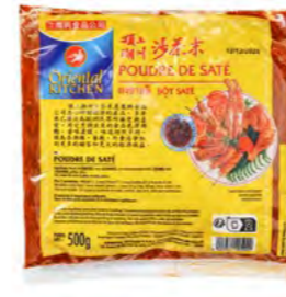
Oriental Sate Gewürzpulver 东方沙爹粉 500 g