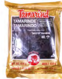
Tamarinde ohne Kerne 无籽罗望子 / 酸角 454 g