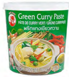
Currypaste grün 绿咖喱酱 12×1 kg