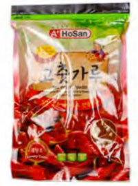
Paprikapulver f. Kimchi 泡菜用红辣椒粉 30×500 g