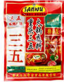
Hotpotsoße SANWU 火锅底料 (三五牌) 60×150 g / 32×300 g