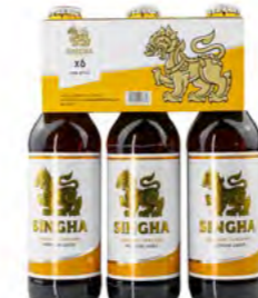
Singha Bier 星河啤酒 24×330 mL