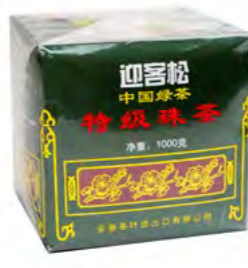
Grüner Tee 绿茶 12×1000 g