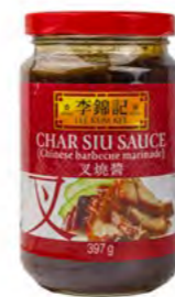
Char Siu Sosse LKK 叉烧酱 (李锦记) 12×397 g