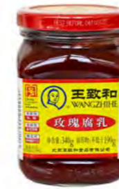
WZH Rose eigelegt 王致和豆腐乳 15×340 g