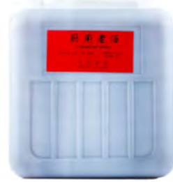
Kochwein Wenzhou 料酒 (温州牌) 4×5 L / 2×10 L