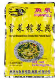
Senfgemüse eingelegt 雪菜榨菜 20×350 g