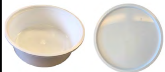
QC115 Suppenschale QC115 白色汤碗