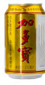
Kräutertee Jiaduobao 加多宝凉茶 24×310 mL