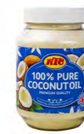
Kokosnussöl 椰子油 12×500 mL