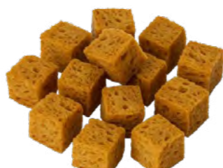
Gluten 烤麸 36×300 g