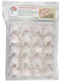
Haukau 虾饺 20×20 Stk.