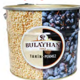
Sesampaste 芝麻酱 10 kg