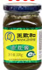
WZH Schnittlauchpaste 王致和非花酱 24×320 g