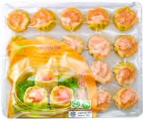
Shao-Mai m. Garnele 虾肉烧麦 20×500 g