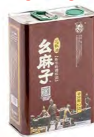
Pfeffer Öl YAOMAZI 么麻子花椒油 4×2,5 L