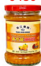
Chilisoße gelb 黄灯笼辣椒酱 24×240 g