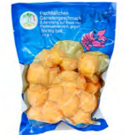
Garnelenball 虾丸 30×200 g