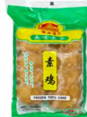
Beancurd Gluteb/Sujee 素鸡 26×500 g