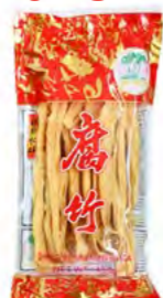
Sojatangen getrocknet 腐竹 150 g