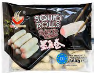
Tintenfischröllchen 鱿鱼卷 16×360 g