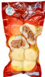
Fisch Tofu Ball mit Pilzen 香菇鱼丸 30×200 g