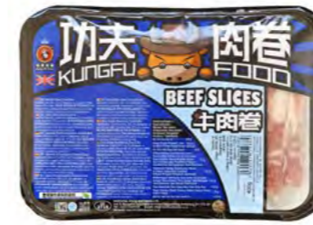
Rindfleisch Scheiben 肥牛卷 20×400 g