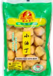
Tofu frittiert (klein) 小油丁 30×150 g