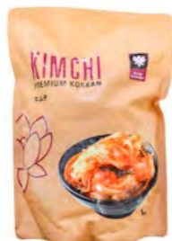
Kimchi tiefgefroren 泡菜 (冰冻) 6×1 kg