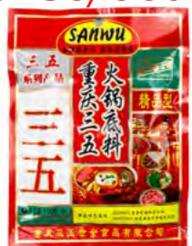
Hotpotsoße SANWU 火锅底料 (三五牌) 60×150 g / 32×300 g