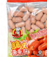
Hühnerwürstchen 脆皮亲亲肠 16×360 g