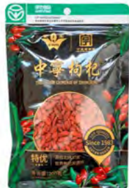
Getrocknete Gou-Qi 干枸杞 200 g