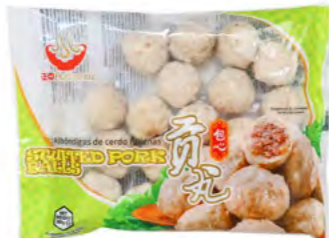
Schweinefleischbällchen gefüllt 猪肉丸 (带馅) 16×360 g