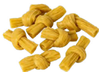
Knoto aus Soja geformt 豆腐结 30×227 g