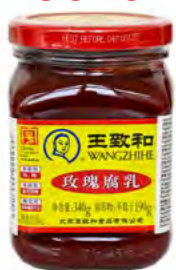
WZH Rose eigelegt 王致和豆腐乳 15×340 g