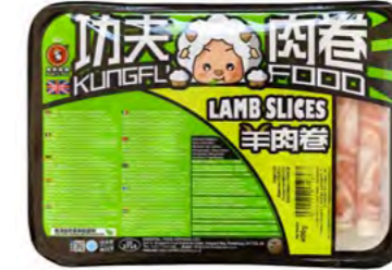
Lammfleisch Scheiben 肥羊卷 20×400 g