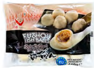
Fischbällchen Fuzhou 福州鱼丸 14×440 g