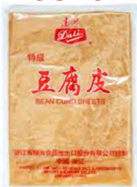
Sojablätte 豆腐皮 250 g