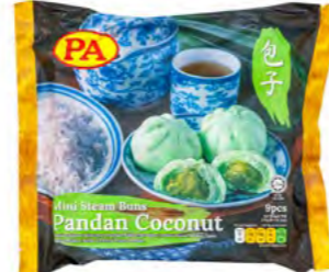
Pandan Kokos Brötchen 甘蓝椰子小笼包 30×270 g/9 Stk.