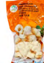
Fischball (Chikuwa) 竹鱼烧 30×200 g