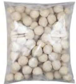
Klebreisbällchen mit Sesam 芝麻球 4×2,5 kg