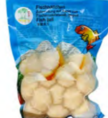
Fischball 鱼丸 30×200 g