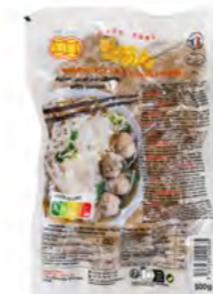
Rinderball mit Sehne 牛筋丸 20×500 g