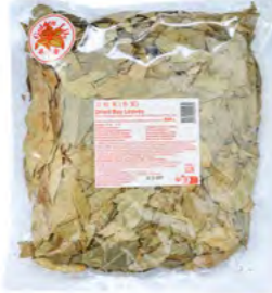
Lorbeerblätter 香叶 500 g