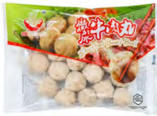
Rindfleischbällchen gefüllt 牛肉丸 (带馅) 16×360 g