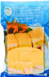
Fischwürfel mit Tofu 鱼豆腐 30×200 g