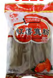
Süßkartoffelnudeln Breit 红薯粉丝 (宽) 20×350 g