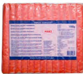
Surimi Sticks "MAKI" Rot MAKI 红色蟹棒 10×1 kg