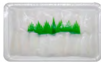
Sushi Sepia Scheibe Sushi Tintenfisch (Yari-Ika) 寿司鱿鱼片 25×160 g