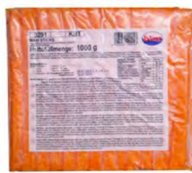
Surimi Sticks "MAKI" orangen MAKI 橙色蟹棒 10×1 kg