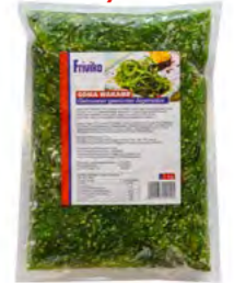
Goma Wakame Seetang Salat 海藻沙拉 12×1 kg