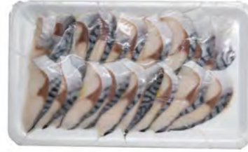
Sushi Markrelenscheiben (Shime Saba) 寿司马林鱼片 (Shime Saba) 20×160 g