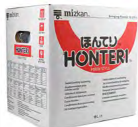
Mirin Mizkan Honteri 调味酒 (Mizkan) 1×18 L