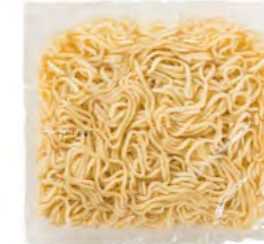
Yakisoba Nudeln 日式炒面 30×150 g