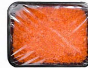
Lachs Froellen Ikura 三文鱼籽 12×500 g