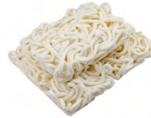
UDON Nudeln TK 乌冬面 8×1150 g / 2× 6×1250 g