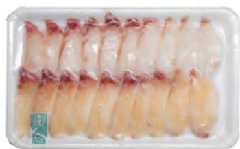
Sushi Tilapiascheibe Sushi Tilapiafilet (Izumidai) 寿司罗非鱼片 20×160 g