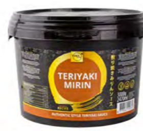
Teriyaki Mirin Sauce (YAMA) 照烧酱 (Yama) 3 kg