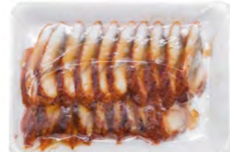
Sushi Aalscheiben (Kabayaki) 寿司鳗鱼片 (蒲烧) 25×160 g