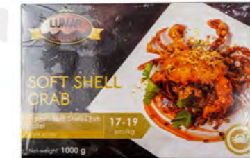
Softshell Krebs 软壳蟹 10×1 kg