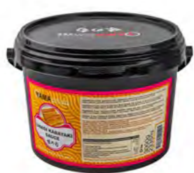
Aalsauce (YAMA) 鳗鱼酱 (Yama) 3 kg