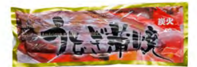
Sushi Aalfilet 10oz Sushi Aalfilet (Kabayaki) 蒲烧鳗鱼 2×5 kg