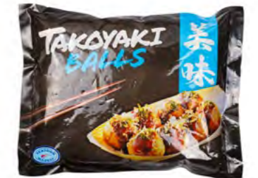
Takoyaki Balls 章鱼小丸子 20×500 g