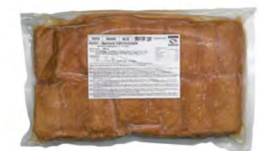
Sushi Tofutaschen mariniert (Inari) 寿司豆腐袋 18×980 g