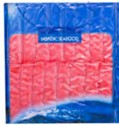
Surimi rot 红色蟹棒 20×500 g