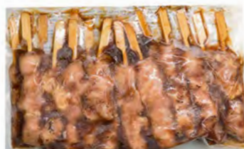
Yakitori Hühnchen Spiess 日式烤鸡肉串 6×1,5 kg