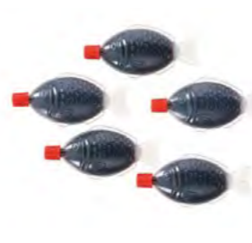
Sojasauce Fischform 8 mL 酱油 (鱼形小包装) 8 mL 4×125 Stk.