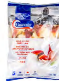
Trogemuschelfleisch (Hokkigai) 北极贝 10×1 kg