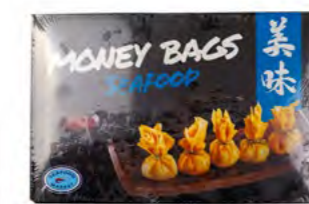
Money Bags Seafood 海鲜福袋 6×800 g / Ca. 47 Stk.