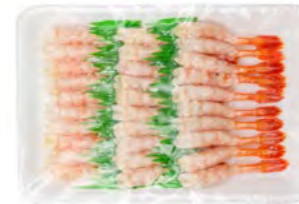
AMA Ebi 寿司甜虾 20×100 g