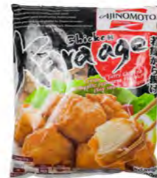
Ajinomoto Chicken Karaage 唐扬鸡块 10×600 g