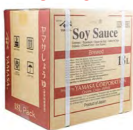
Sojasauce Yamasa 酱油 (Yamasa) 1×18 L