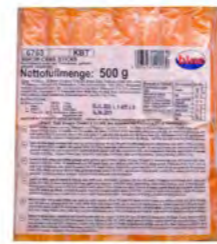
Surimi orange 橙色蟹棒 20×500 g