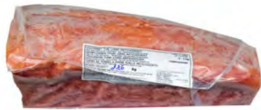
Thunfisch Loins 金枪鱼肉 1×25 kg, 2-4 kg/Stk.