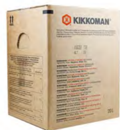
Sojasauce Kikkoman 酱油 (Kikkoman) 1×20 L