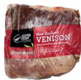
Hirschkeule vierterschnitt 鹿肉 Ca. 15 kg