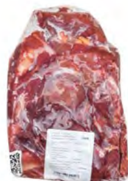
Straußensteak 鸵鸟肉排 Ca. 15 kg