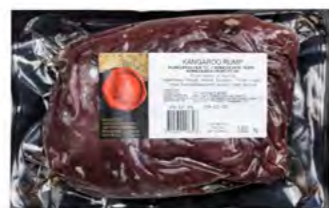
Känguru Hüftsteak 袋鼠肉排 Ca. 10 kg