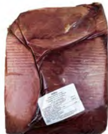
Zebra viertelschnitt 斑马肉 Ca. 10 kg