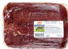
Ziegefilet Vakuum TK 山羊肉 (真空包装) Ca. 10 kg