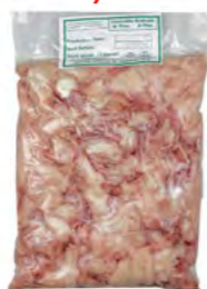
Krokodilfleisch 鳄鱼肉 4×2 kg / 8×1 kg