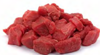
Guanaco Gulasch 羊驼肉 4×2 kg